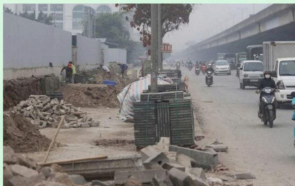
Ảnh minh họa: Nguồn Internet

a) Phạt tiền từ 3.000.000 đồng đến 5.000.000 đồng đối với xây dựng nhà ở riêng lẻ hoặc công trình xây dựng khác;