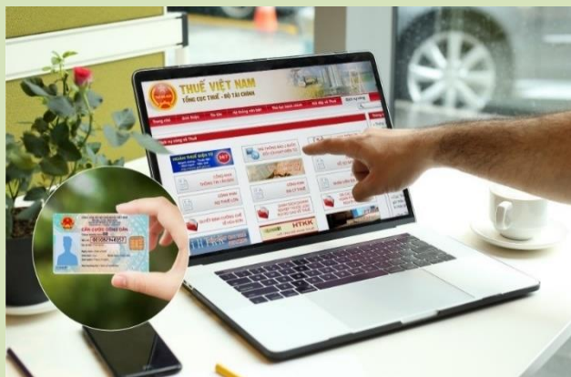
Hình ảnh minh họa: nguồn internet

- Tổ chức nước ngoài, cá nhân nước ngoài có hoạt động kinh doanh tại Việt Nam hoặc có thu nhập phát sinh tại Việt Nam là người nộp thuế theo quy định của pháp luật về thuế;