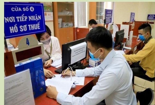
Hình ảnh minh họa: nguồn internet

- Tổ chức, hộ gia đình, hộ kinh doanh, cá nhân, cá nhân kinh doanh nộp các khoản thu khác thuộc ngân sách nhà nước theo quy định của pháp luật;