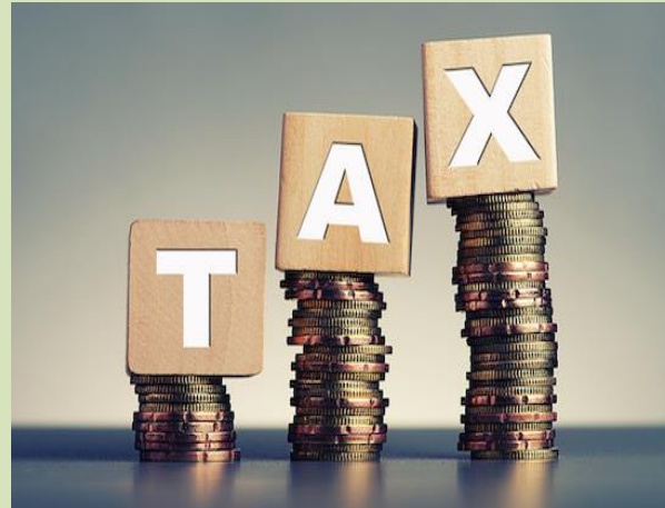
Hình ảnh minh họa: nguồn internet

công chức quản lý thuế thi hành công vụ. Chống đối, trì hoãn, không cung cấp thông tin, tài liệu phục vụ kiểm tra, giám sát thuế, khoản thu khác.