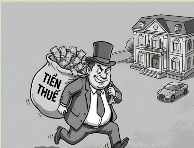
Hình ảnh minh họa: nguồn internet

cơ quan quản lý thuế để chuyển giá, trốn thuế, khoản thu khác, gian lận, trục lợi tiền thuế, tiền ngân sách nhà nước. Lợi dụng chức vụ, quyền hạn để tiết lộ hoặc làm rò rỉ thông tin người nộp thuế trái quy định. Làm sai lệch kết quả kiểm tra, xử lý vi phạm pháp luật về thuế. Gây phiền hà, sách nhiễu đối với người nộp thuế. Lợi dụng để chiếm đoạt hoặc sử dụng trái phép tiền thuế, khoản thu khác.