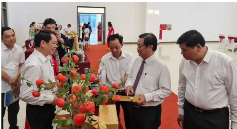
Bộ trưởng Bộ Nông nghiệp và Phát triển nông thôn Lê Minh Hoan thăm gian hàng giới thiệu sản phẩm nông nghiệp tiêu biểu tại Hà Giang

Phát triển nông nghiệp, nông thôn, nâng cao đời sống vật chất và tinh thần của nông dân và cư dân nông thôn là trách nhiệm, nhiệm vụ trọng tâm của cả hệ thống chính trị và toàn xã hội.