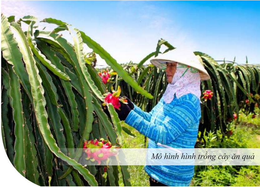
Mô hình hình trồng cây ăn quả