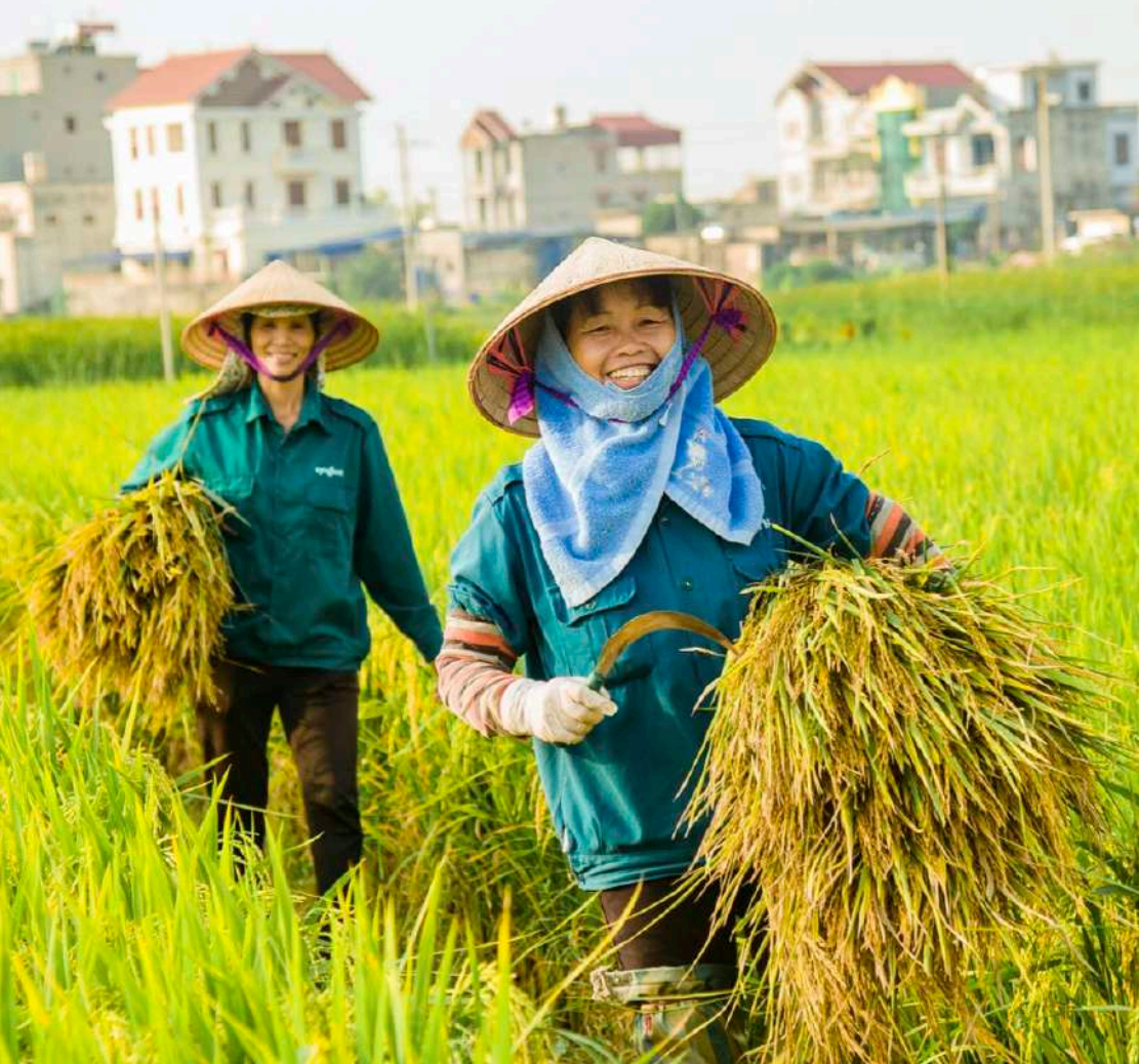
Nụ cười mùa vàng của nông dân Việt Nam