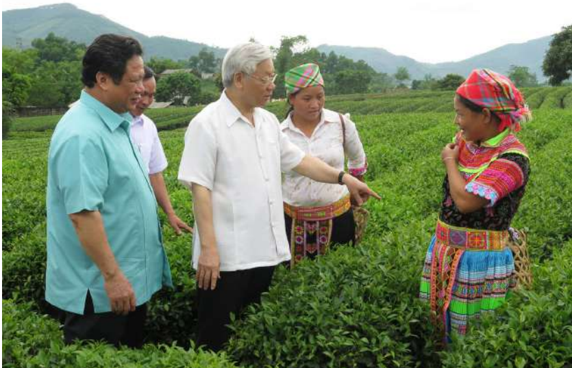
Tổng Bí thư Nguyễn Phú Trọng thăm đồi chè tại xã Mỹ Bằng, huyện Yên Sơn, tỉnh Tuyên Quang và hỏi thăm đời sống của đồng bào các dân tộc thiểu số

Sau 10 năm Đổi mới, Ban Bí thư đã ra Nghị quyết 06 ngày 10/11/1998 về một số vấn đề phát triển nông nghiệp và nông thôn, trong đó đưa ra một số mục tiêu về phát triển nông thôn như: Giải quyết việc làm, nâng cao thu nhập của dân cư nông thôn; xóa hộ đói, giảm tỷ lệ nghèo; phát triển cơ sở hạ tầng kinh tế - xã hội nông thôn, chú trọng phát triển hệ thống thủy lợi, bảo đảm đường giao thông thông suốt đến trung tâm xã, có đủ trường học, trạm y tế và nước sạch cho sinh hoạt; bảo vệ môi trường sinh thái, ngăn chặn nạn phá rừng; thực hiện tốt quy chế dân chủ, bảo đảm ổn định chính trị xã hội và đoàn kết nông thôn.