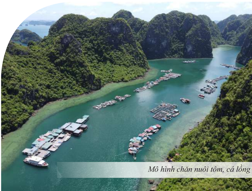
Mô hình chăn nuôi tôm, cá lồng