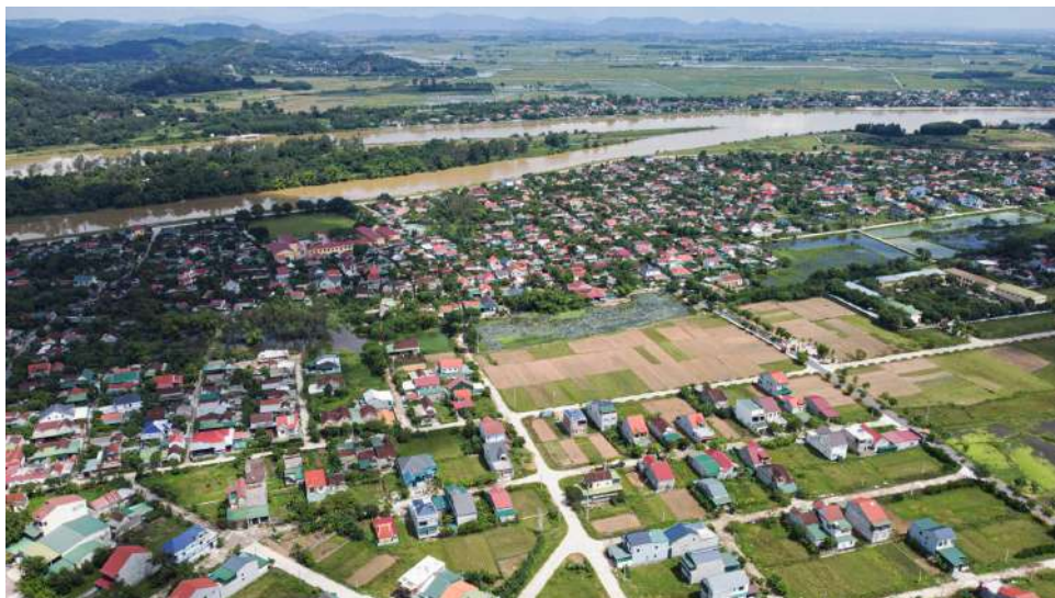
Quy hoạch trong xây dựng NTM đi trước một bước sẽ tạo nên những bức tranh đẹp ở các vùng nông thôn mới ở Việt Nam