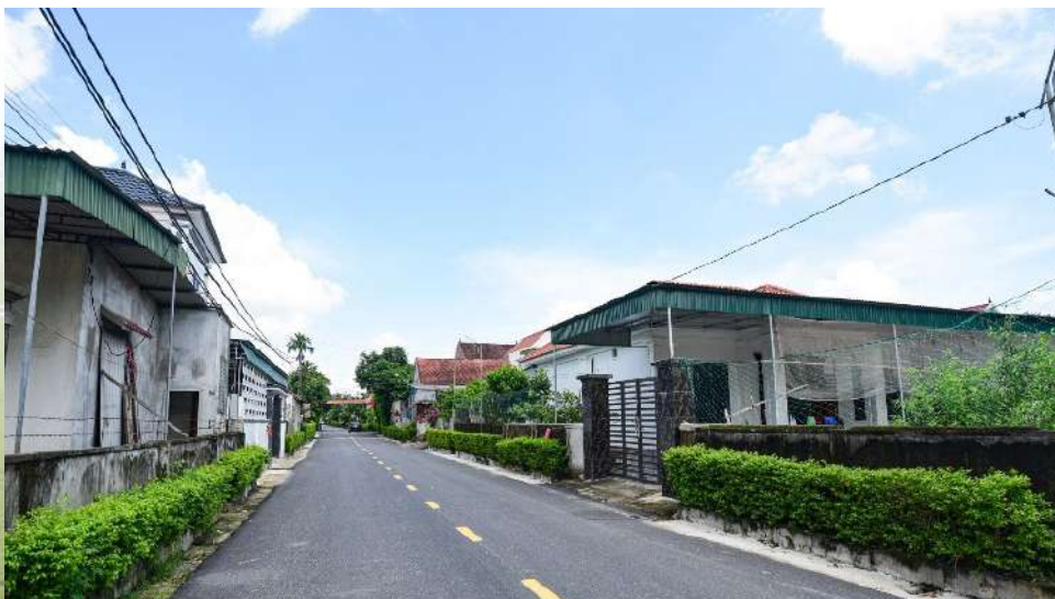
Cận cảnh những con đường thôn quê trải nhựa thẳng tắp