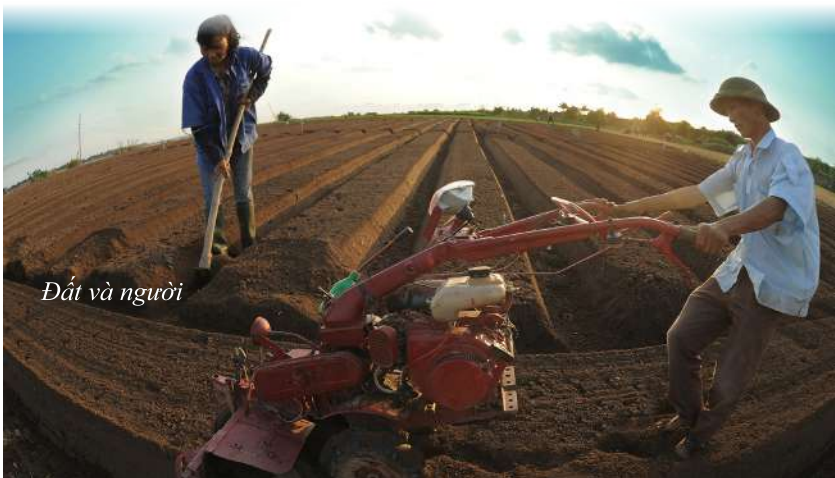
Đất và người

Ngày 08/9/2006, Bộ trưởng Bộ Nông nghiệp và Phát triển nông thôn đã ban hành Quyết định số 2614/QĐ/BNN-HTX về việc phê duyệt Đề án thí điểm xây dựng mô hình NTM cấp thôn, bản. Mục tiêu của chương trình nhằm thí điểm xây dựng mô hình NTM theo phương pháp tiếp cận dựa vào nội lực cộng đồng để tổng kết, làm cơ sở cho việc xây dựng cơ chế, chính sách hỗ trợ Chương trình xây dựng NTM.