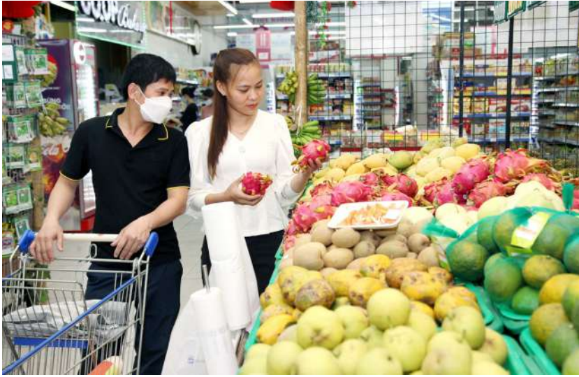
Đưa nông sản gần hơn đến tay người tiêu dùng

đường sản xuất nông nghiệp lấy tiêu chí sản lượng để làm mục tiêu phấn đấu nữa, mà bắt đầu có rất nhiều nghiên cứu tư duy cần làm gì để tạo ra giá trị gia tăng theo xu thế kinh tế nông nghiệp.