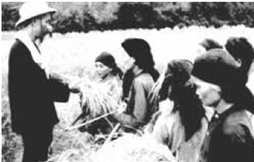
Bác Hồ thăm bà con nông dân xã Hùng Sơn, huyện Đại Từ, tỉnh Thái Nguyên (1954)

chất lượng các trạm y tế, sửa sang đường sá, cầu cống... xây dựng dần dần nông thôn mới”.