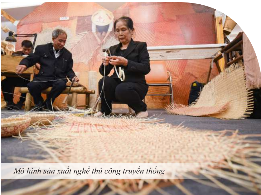
Mô hình sản xuất nghề thủ công truyền thống