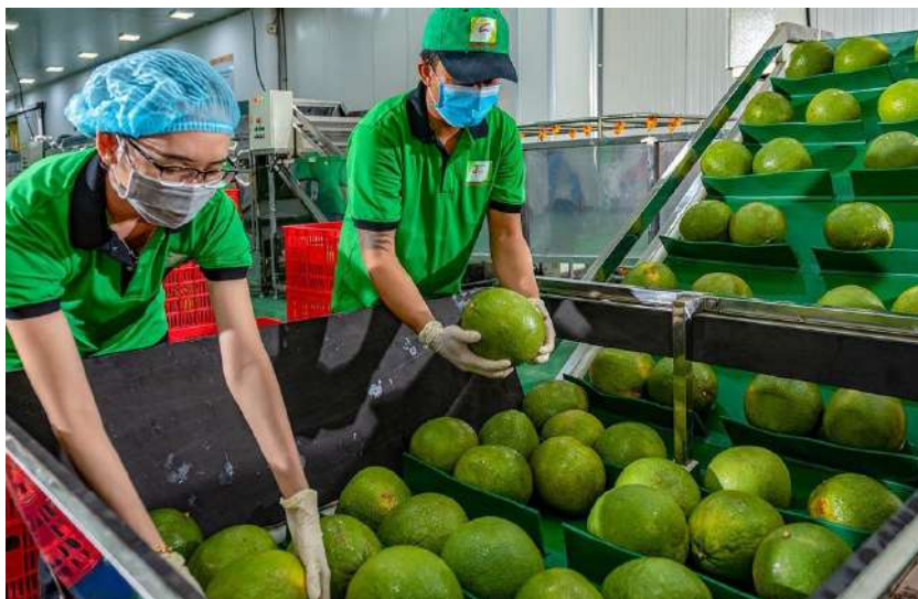
Đảm bảo quy trình bảo quản nông sản để xuất khẩu