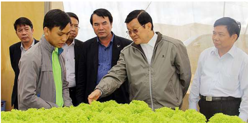
Nguyên Chủ tịch nước Trương Tấn Sang thăm mô hình sản xuất rau ở Lâm Đồng.

Sau 3 năm triển khai, Chương trình có sự vào cuộc mạnh mẽ từ các cơ quan Trung ương cho đến địa phương, doanh nghiệp, tổ chức tín dụng và người dân nông thôn.