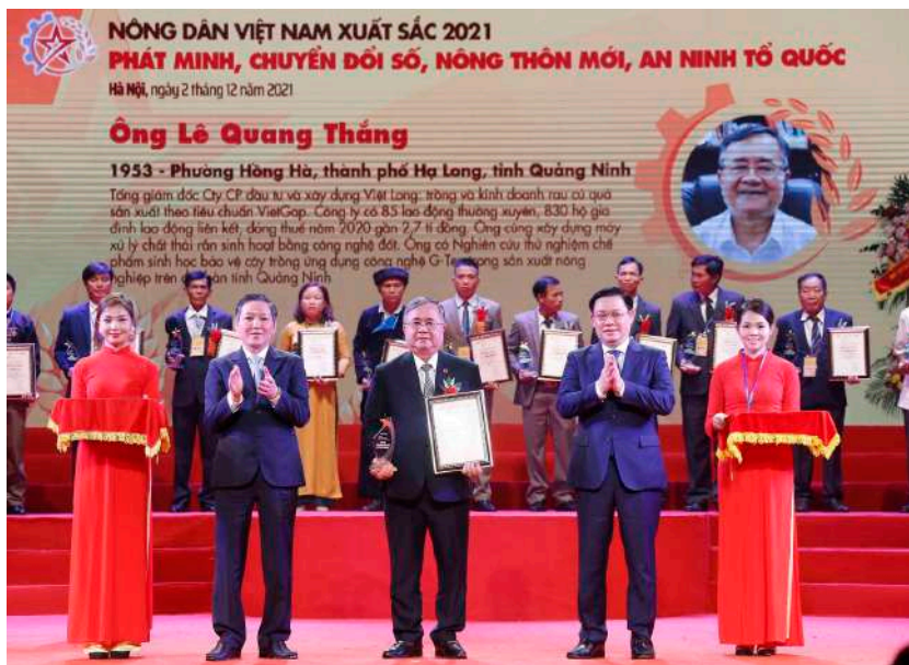
Khen thưởng kịp thời trong xây dựng NTM là rất quan trọng

tại điểm b khoản 4 Điều 1 Nghị quyết số 24/2021/QH15, Điều 7 Quyết định số 1945/QĐ-TTg ngày 18/11/2021 của Thủ tướng Chính phủ; ban hành quy chế hoạt động của Ban Chỉ đạo cấp tỉnh và kiện toàn Ban Chỉ đạo cấp huyện, Ban Quản lý cấp xã, Ban giám sát đầu tư cộng đồng, Ban phát triển thôn để phân công, phân cấp, thống nhất công tác chỉ đạo, điều hành và phối hợp trong triển khai thực hiện các chương trình tại các cấp.